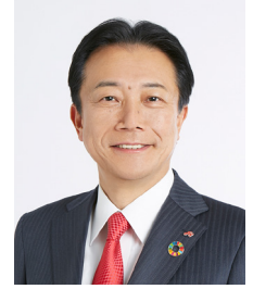
Taro Fujie Temsilci İcra Amiri Başkan & İcra Kurulu Başkanı, Ajinomoto Co., Inc.

AGP, tüm faaliyetlerimize uygulanır ve tüm paydaşlarımıza bunları destekleyeceğimize dair yazılı bir taahhüt sunar. Amacımız, yaptığımız her işte AGP'yi destekleyerek güven kazanan gerçek bir küresel uzmanlık şirketi olmaktır.