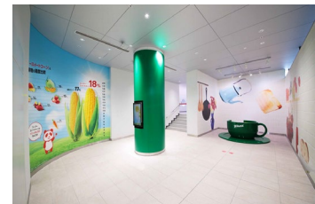
＜スープ見学コース(一部)＞

味の素グループは、“Eat Well, Live Well.”の実現に向け、今後も生活者に安心して召し上がっていただける製品を安定的にお届けできるよう、バリューチェーンの強化を図り、生活者の「食」と「健康」に貢献し続けます。