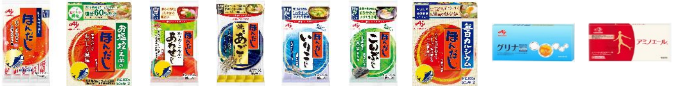
<味の素食品(株)三重工場の主な生産品目>

当社は目指す姿を「食と健康の課題解決企業」と定め、その実現へ向けて国内食品の生産体制再編を進めています。この取り組みの一環として、国内調味料・加工食品の生産を担う新会社、味の素食品(株)を2019年4月に発足させ、国内工場を段階的に集約する構造改革を進行中です。本工場はこの計画において竣工する最初の工場であり、包装を担っていた関西工場の機能を同工場に移管・集約し、「ほんだし®」の製造・包装一貫生産を実現します。また、この工場では「グリナ®」、「アミノエール®」等成長領域であるサプリメントも生産します。