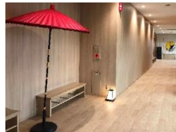
<「ほんだし®」見学コース(一部)>

味の素グループは、“Eat Well, Live Well.”の実現に向け、今後も生活者に安心して召し上がっていただける製品を安定的にお届けできるよう、バリューチェーンの強化を図り、生活者の「食」と「健康」に貢献し続けます。