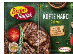
メニュー用調味料